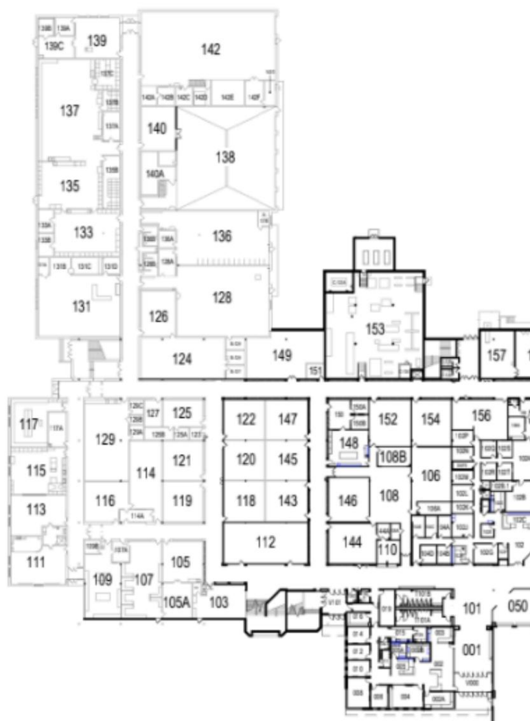
1er piso norte